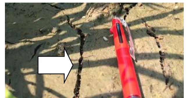
《小ヒビのイメージ図》