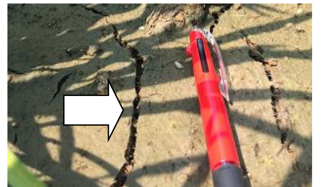
《小ヒビのイメージ図》